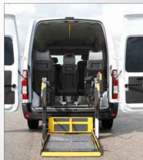
Sollevatore Doppio Braccio

Opel Movano può essere allestito per trasporto persone con disabilità con sollevatore Fiorella Slim Fit nelle versioni F360 (la versione standard con piattaforma di dimensioni 1030x714 mm) e F360EX (la versione Extended con piattaforma di dimensioni 1075x765 mm, più grande e adatta anche al trasporto delle carrozzine più ingombranti). Entrambe le versioni del sollevatore Fiorella Slim Fit possono essere installate anche sul vano d'ingresso laterale di Opel Movano.