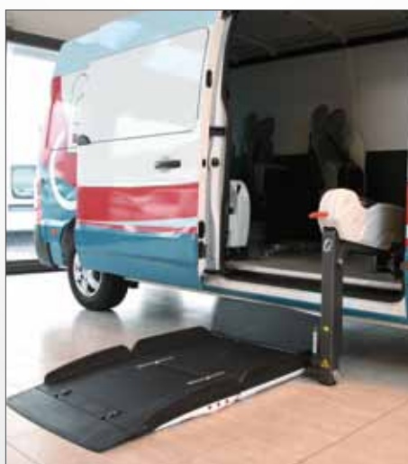
Sollevatore Fiorella Slim Fit F360EX