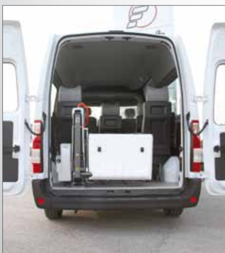
Sollevatore Fiorella Slim Fit F360